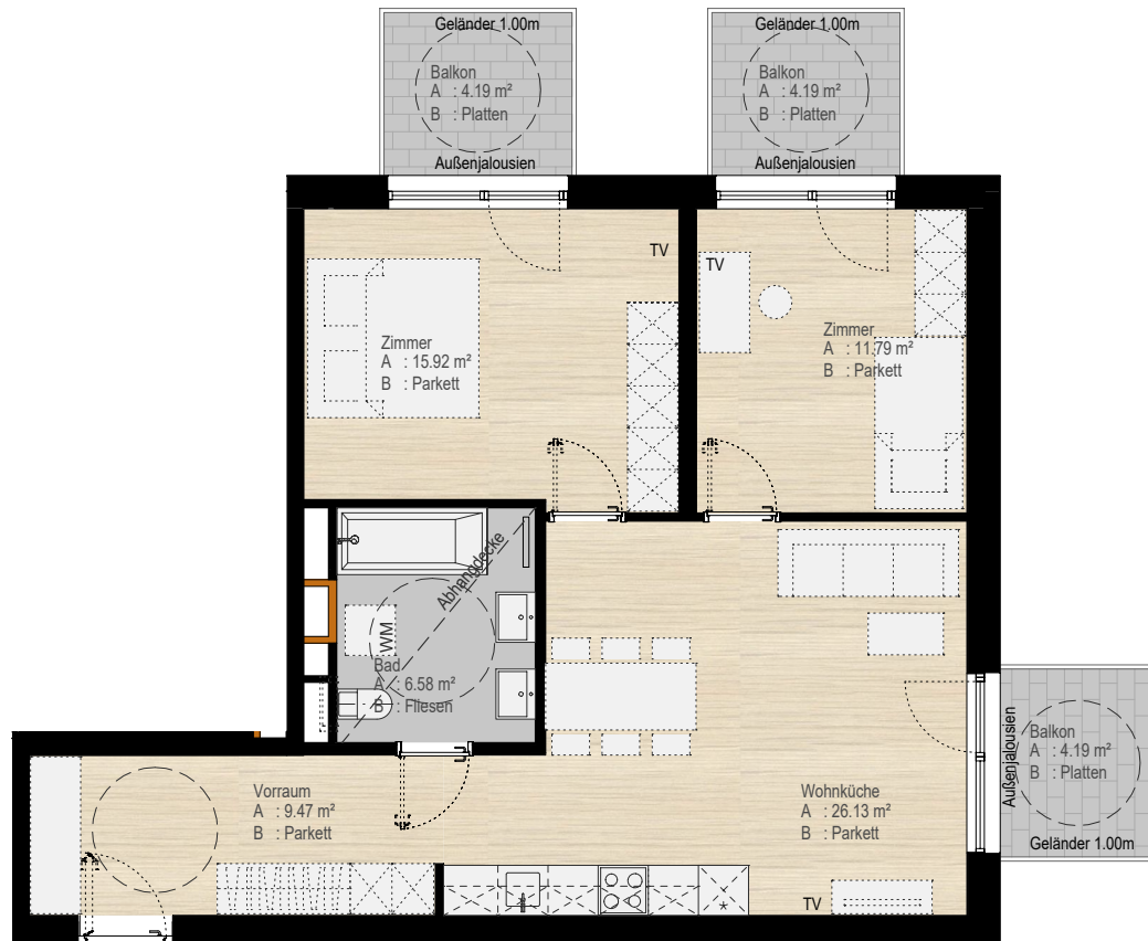
TOP 47 3 Zi.