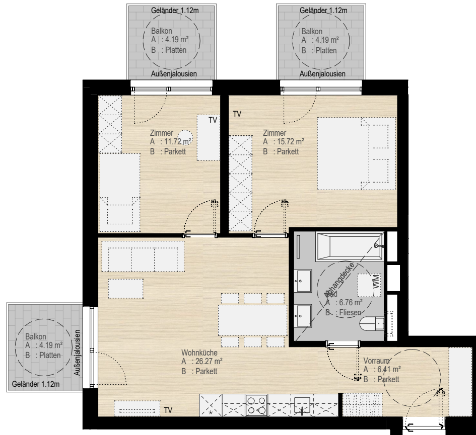
TOP 64 3 Zi.